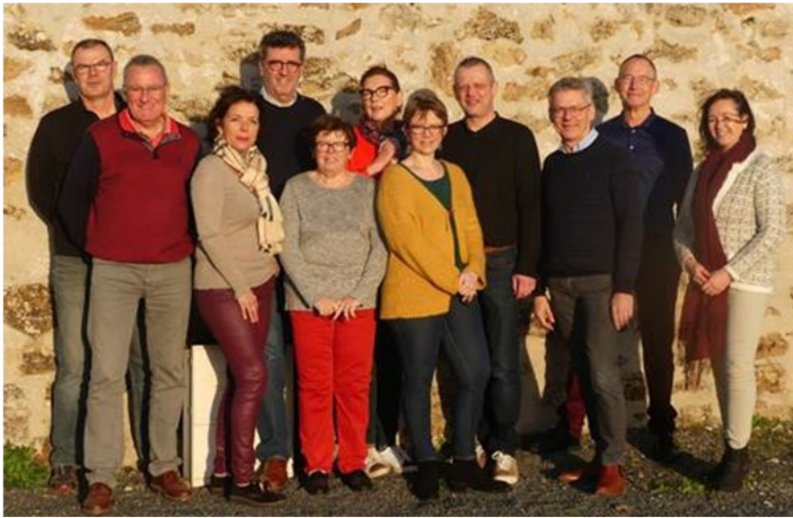
Le conseil municipal de Parnay

Les travaux des commissions sont soumis aux mêmes règles que celles du Conseil Municipal, sauf une exception : les séances de commissions ne sont pas publiques. Les commissions sont composées du Maire, président de droit, et de conseillers municipaux. Un adjoint ou un conseiller délégué peut être responsable de la commission. Des personnes qualifiées extérieures peuvent participer à leurs travaux préparatoires à titre d'expert et avec voix consultative