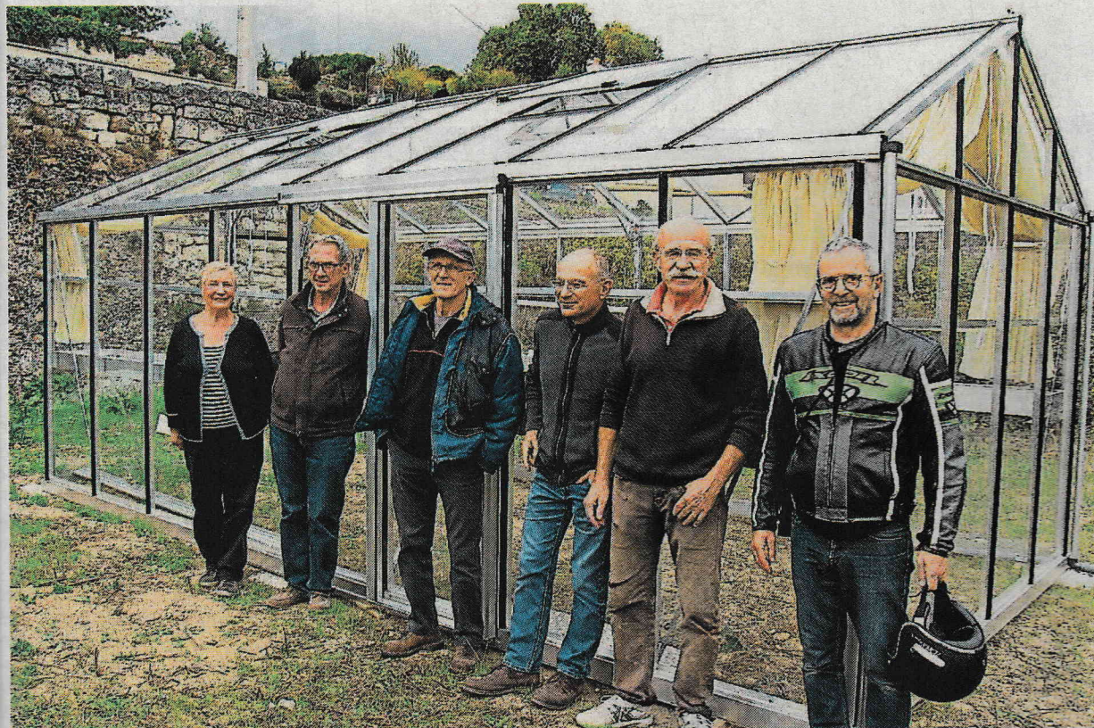
Parnay, terrain à l'angle de la rue et de l'impasse Valbrun. La serre solidaire a été montée en une journée.

L'association des Ligériens de cœur inaugurera samedi sa serre solidaire.